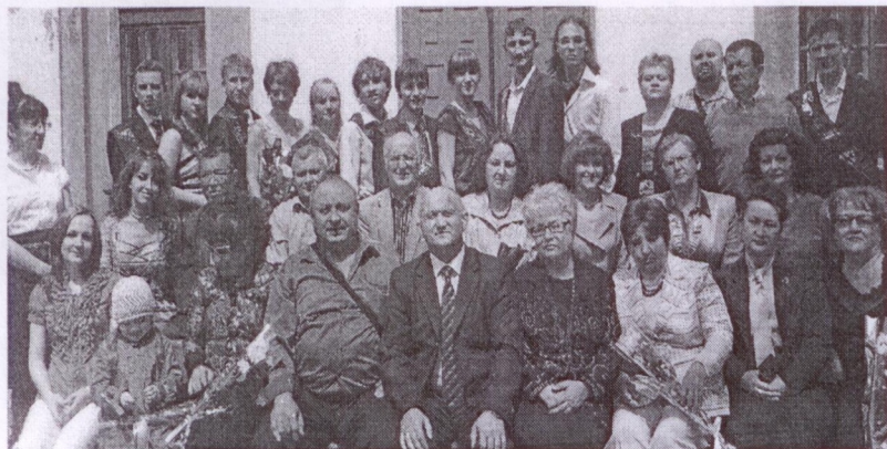
Амурский областной музыкальный колледж Юбилейный выпуск 2011г.